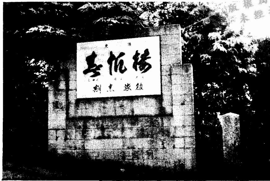
日本下關的春帆樓。注意最下四字：割烹旅館！